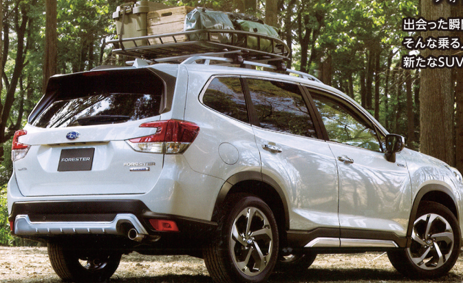
PHOTO:Advance クリスタルホワイトパール(33,000円高消費税込0%込み) ルーフレール(ロフホール付)、アイサイトセーフティプラス(視界拡張)は メーカー装着オプション 写真はイメージです。

出会った瞬間から、まだ見ぬ冒険に心が奮い立つ— そんな乗る人のアクティブマインドを刺激する、 新たなSUVの姿がここに 있습니다。