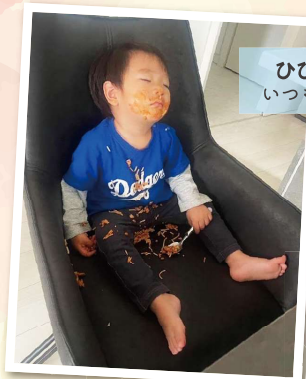
ひびきくん(1歳11ヶ月) いつもご機嫌ペーポーイ