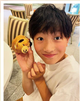
れんくん(10歳) 自他共に認める高身長イケメン