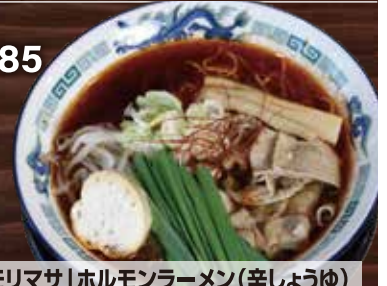
「モリマサ」ホルモンラーメン(辛しょうゆ) ※黒しょうゆも選べます ¥1,300

👉 なんてもあびー3 阿寒町モリマサ商店の放牧豚ホルモン使用で地産地消を応援!!