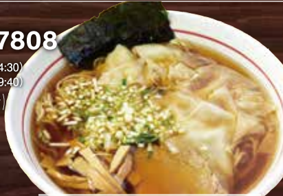
しょうゆワンタン ¥1,050

👉 なんてもあびー3 国産厳選素材使用のつると食感のワンタンと自慢のしょうゆが合う!!