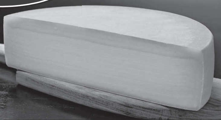
モール温泉で磨く「十勝のラクレット モールウォッシュ」1,188円(150g)