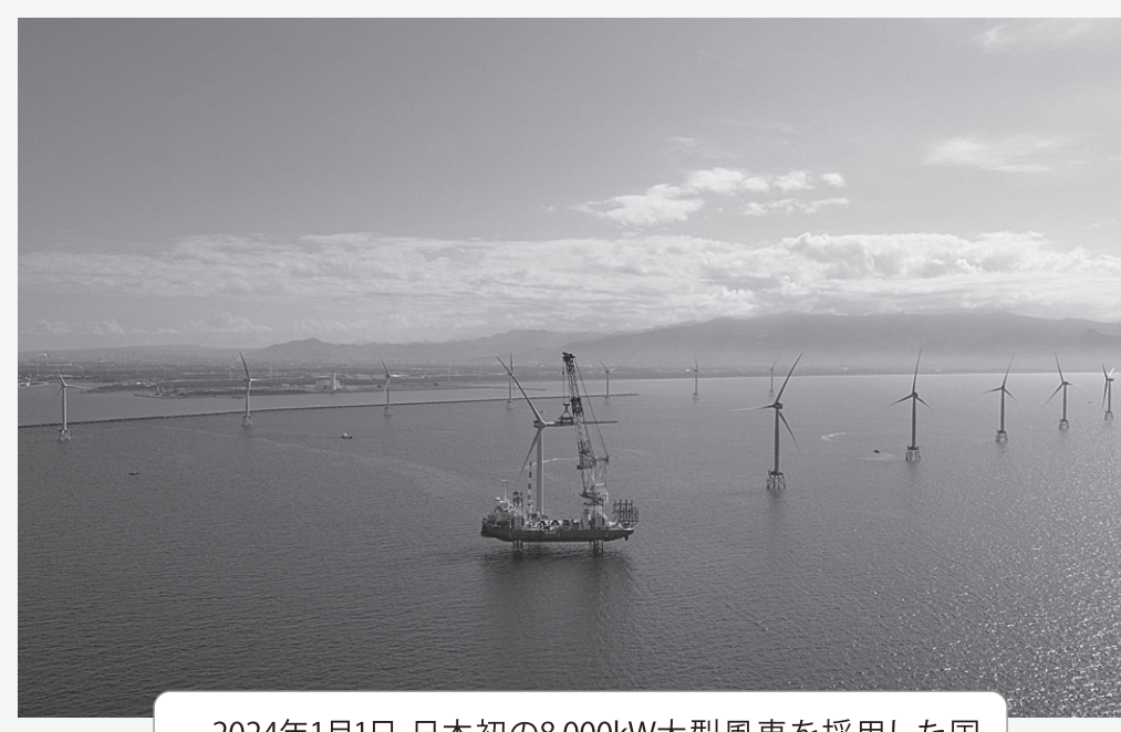
2024年1月1日、日本初の8,000kW大型風車を採用した国内最大規模の商用洋上風力発電所である「石狩湾新港洋上風力発電所」が商業運転を開始した。